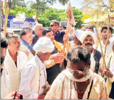
किसानों ने प्रधानमंत्री नरेंद्र मोदी का धन्यवाद जताते हुए अपने हक की आवाज भी मजबूती से उठाई।