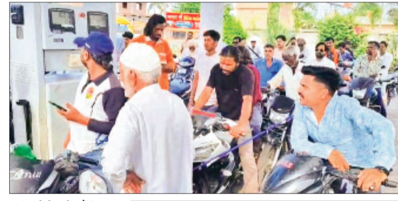
सभी लोगों को धैर्य रखना चाहिए। भारत सरकार व्यवस्थाएं कर रही है। यदि थोड़ी बहुत तकलीफ है तो उसे दूर किया जाएगा।